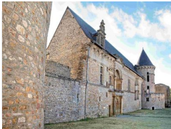
17.4km – Château d'Assier