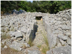
1.6km – Dolmen de la table de Roux