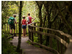
7.9km – Réserve Naturelle Régionale du Marais de Bonnefont