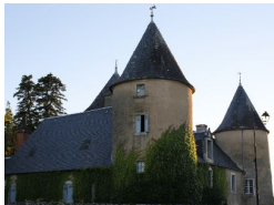
0.1km – Château de Padirac