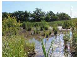
7.9km – Une réserve naturelle