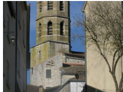
9.5km – Église Saint-Hilaire