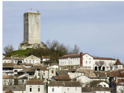
9.3km – Donjon de Montcuq