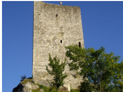
9.2km – Tour de Montcuq