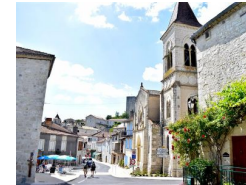
9.9km – Église Saint-Privat