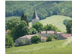
13.6km – Église Saint-Pierre de Rouillac