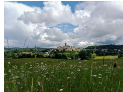
9.7km – Montcuq-en-Quercy-Blanc