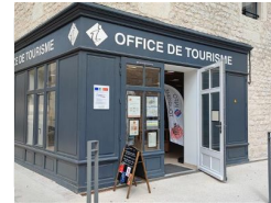
9.8km – Office de Tourisme Cahors Vallée du Lot - Bureau d'information de