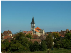
0.2km – Payrac