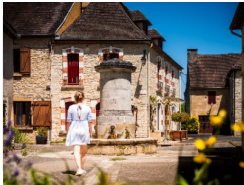
18.1km – Salviac