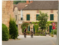
18.1km – Goujounac