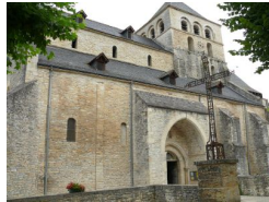
18.1km – Catus