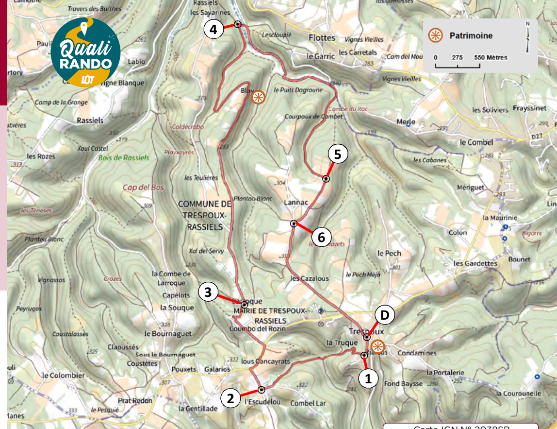
Carte IGN N° 2038SB

⑦ À l'intersection suivante, prenez de nouveau à gauche jusqu'à la D 27. Traversez-la et continuez jusqu'au point de départ.