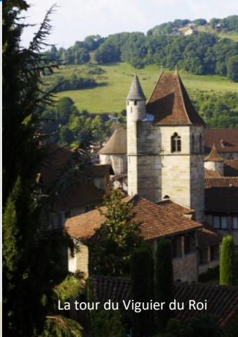
La tour du Viguiers du Roi

« Un panorama sur Figeac depuis la causse »