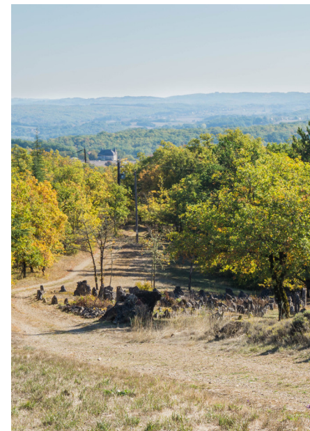
OTCS - Salomé Monceaux