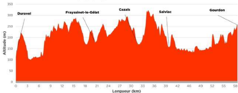
Profil topographique Tronçon 6 - Duravel - Gourdon