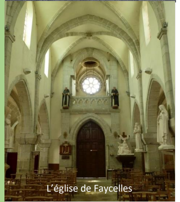
L'église de Faycelles