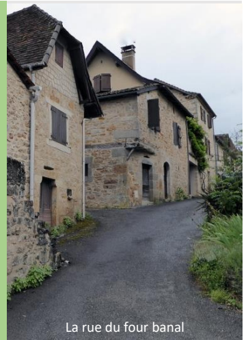
La rue du four banal

4) Arrivé à la D21, l'emprunter par la gauche jusqu'au hameau de la Valade. Traverser ce hameau pittoresque en suivant la D21 (vous pouvez prendre le temps d'aller voir la fontaine et le lavoir qui sont signalés) et à la dernière habitation, sur votre gauche, emprunter le sentier à gauche. Rejoindre une voie communale, prendre à droite. Arrivé au sommet, prendre à gauche sur la D21 et le GR65, passer devant l'église, se diriger vers le monument aux morts et regagner le parking.