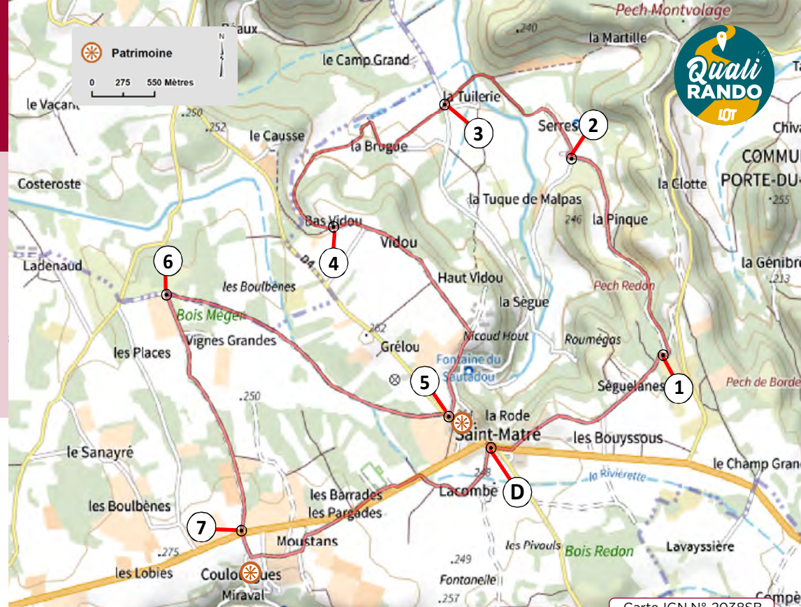
Carte IGN N° 2038SB

⑧ Traversez la route (prudence), et poursuivez vers le hameau de « Coulourgues ». Allez jusqu'à la chapelle. Prenez à droite pour quitter le hameau. Au croisement allez tout droit et passez au milieu des propriétés viticoles. Longez la D656 sur 20 m et traversez-la (prudence), vers le chemin en castine en face. Traversez le sous-bois bordant le stade puis suivez le chemin longeant la D 656. Empruntez à droite, le tunnel passant sous la route (attention, passage dangereux en cas d'intempéries). Prenez à droite la petite route vers le lieu-dit « Lacombe » et suivez-la jusqu'au centre du village.