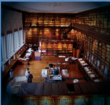
Visite guidée à la lanterne