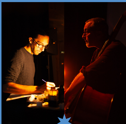
Périt le soleil : voyage onirique autour de Rimbaud