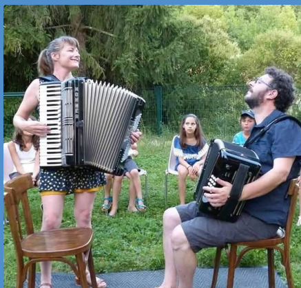
Autour de l'accordéon