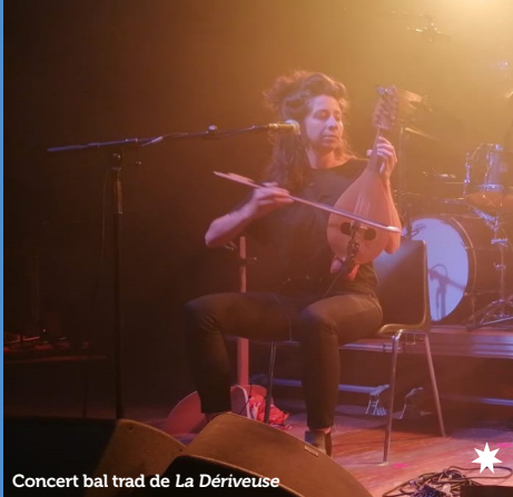
Concert bal trad de La Dériveuse