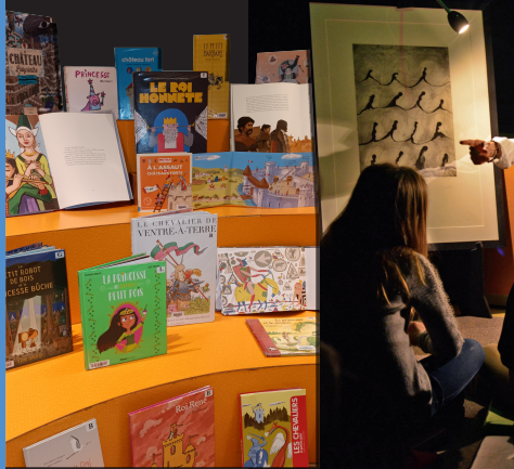
Heure du conte