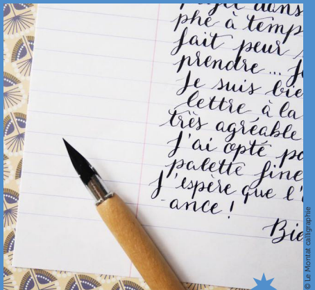
Initiation à la calligraphie