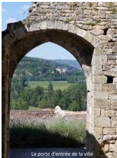
La porte d'entrée de la ville

Entre Cajarc et Saint-Circq-Lapopie, la silhouette découpée de Calvignac plonge de 100m dans les reflets d'un méandre du Lot. Agglomération à trois étages, due aux nécessités d'une topographie contraignante, le castrum originel se composait d'un fort, d'une ville, quartier bourgeois et roturier fermé par des portes, et de barris, quartiers ouverts aux derniers arrivants, implantés hors des murailles.