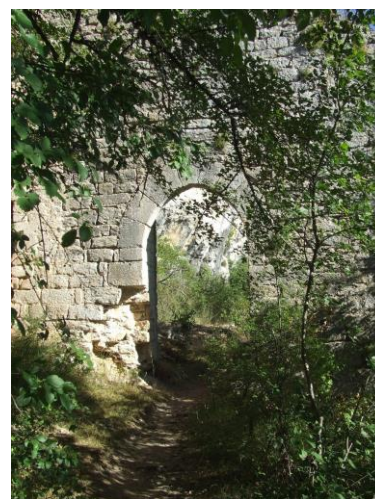
la porte fortifiée