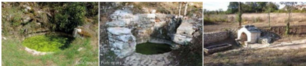
Puits avant Puits après