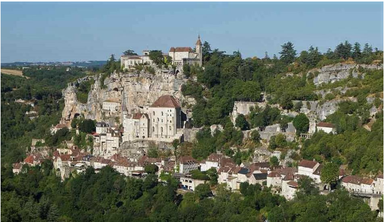
Rocamadour, un des plus beaux villages de France à 7km