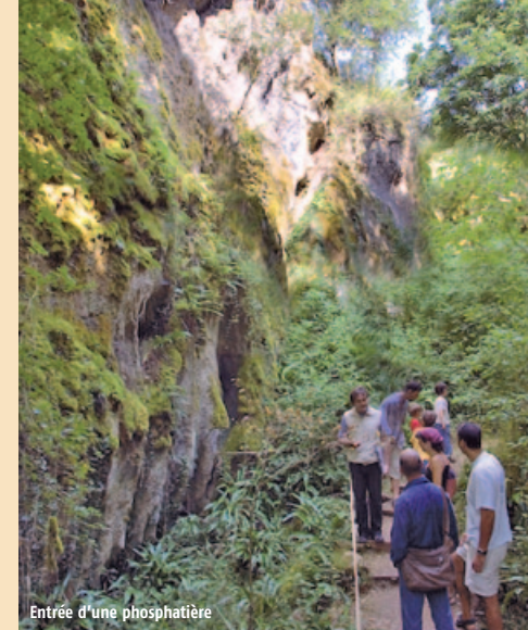
Entrée d'une phosphatière

Quelques traces révèlent que ces «trous à phosphate» ont jadis été le théâtre de la frénétique extraction d'un minerai utilisé comme engrais. Aujourd'hui, d'étranges chercheurs armés de sacs et de marteaux y trouvent d'innombrables fossiles, tant qu'à l'ère tertiaire s'étendait ici une savane ou une forêt tropicale. Grâce à eux, les phosphatières du Quercy constituent, entre lumière et monde souterrain, un véritable «laboratoire naturel de l'Evolution».