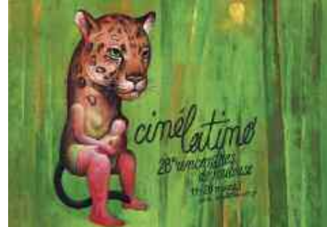
Affiche réalisée par Ronald Curchod

80 invités latino-américains Plus de 400 professionnels accrédités, 60 journalistes de la presse locale, nationale et internationale.